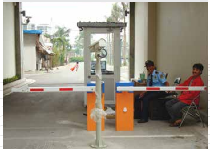
TÒA NHÀ EASTERN 2013