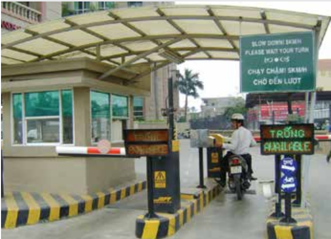
THE MANOR I - 2008