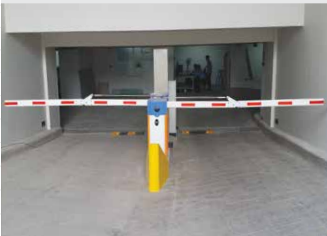
TÒA NHÀ VRG 2015